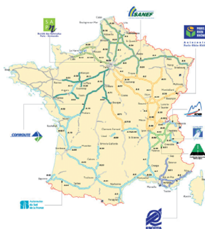
Répartition des sociétés autoroutières (ASFA)

Son identification en tant que structure collective et la détermination du produit vendu n'a pas été sans poser problème. La finalité du spot, questionnée à nouveau, a permis de faire apparaître la notion d'image, de représentation favorable d'un secteur de transport qui bénéficierait à l'ensemble des sociétés autoroutières. Ce qui devrait se traduire financièrement par une augmentation généralisée des recettes de péage.