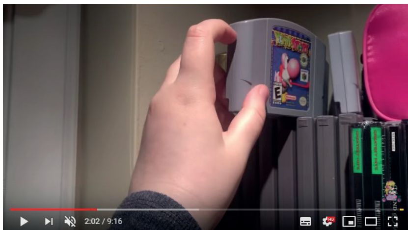
Figure 5. Capture d'écran de la chaîne QueenofRabites . Vidéo intitulée « Game room tour ».

position en tant que dispositif de monstration (Davallon, 1999) et de la visite guidée (Gellereau, 2005). Si une collection rassemble des objets « soumis à une protection spéciale et exposés au regard dans un lieu clos aménagé à cet effet » (Pomian, 2001), la plateforme YT permet ici au contraire de rendre public ce lieu protégé, ce qu'explicite Acksell de la chaîne GHM : « L'idée de départ de la chaîne c'est de présenter la collection » 22 (Ce dernier mentionne par ailleurs un projet de présentation en présence de certaines pièces de sa collection dans sa municipalité, ainsi que les contraintes que cela imposerait).