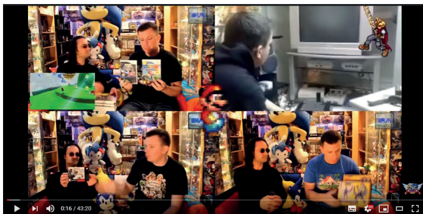
Figure 4. Capture d'écran de la chaîne Green Hill Memories (générique).

Ça fait vraiment sanctuaire. C'est tout petit, c'est confiné [...] après une journée de taf [...] tu rentres là-dedans tu te fais une partie [expiration] on vit ! [...] Tu peux pas juste dire une collection c'est fait pour jouer, il y a aussi [...] le côté esthétique [...] Moi je rentre là-dedans, ça me fait briller les yeux. C'est mon trip, il y a plein de jeux que j'avais quand j'étais gamin, il y a plein de souvenirs, plein de nostalgie. [...] C'est des jeux que tu vas ranger [...] positionner différemment [...] 18 .