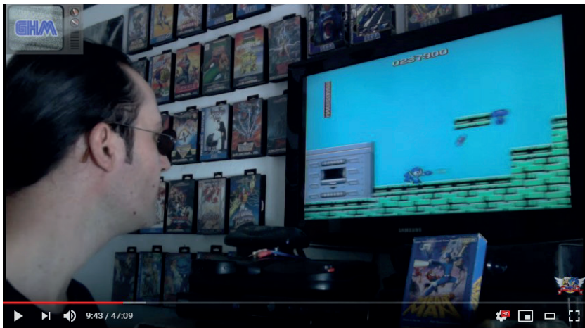
Figure 2. Capture de la chaîne Green Hill Memories. Vidéo intitulée « [VideoGuide #005] DGJX termine Megaman sur Nintendo ! ».