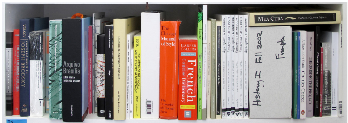
④ Quelques livres de la bibliothèque Frampton.