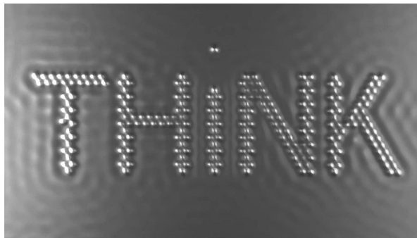
Figure 2. Think écrit avec des molécules de CO positionnées sur une plaque de cuivre. à -268,15 °C par un microscope à effet tunnel. Chaque image fait 45 x 25 nm. Extrait du film : A Boy and His Atom (IBM Research – Almaden)

La mécanique quantique entretient une certaine obscurité et un certain hermétisme. Elle a été conçue dans l'idée que ses objets resteraient définitivement inaccessibles. Or l'évolution de la technologie nous a permis d'atteindre ce qui était autrefois inimaginable. Il est maintenant possible de voir les atomes et de les manipuler avec des microscopes à effet tunnel et plus récemment, d'apercevoir l'orbitale d'atomes d'hydrogène.